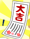
初詣のおみくじで、なんと「大吉」が5名も! 良い年になりますように!