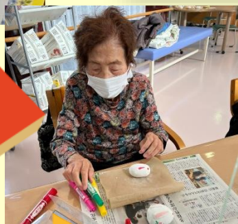
コロナ禍で中々外出活動ができない中、感染対策を行いながら、コロナ終息・健康祈願をみんなで行いました