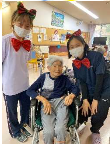
風船割りや職員 の仮装で久しぶり の大騒ぎ。