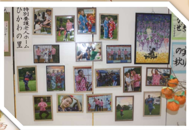
11月26日、東陽ス ポーツセンターにおいて、 「東陽町文化の祭典」が 開催され、ひかわの里か らもたくさんの作品を出 展しました。