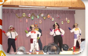
最後は、商工会の皆様 の熱烈なリクエストで「純烈 made in ひかわの里」が 登場!!大盛り上がりとなり ました。