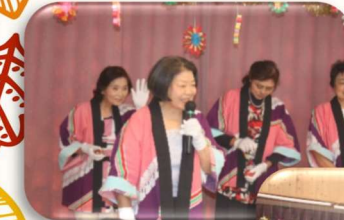
皆さんが集まって 楽しい時間を過ごす のは久しぶりで す。