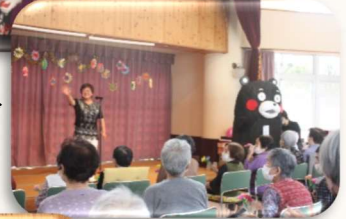
歌やダンスなど、たく さんの出し物を披露 して頂きました。